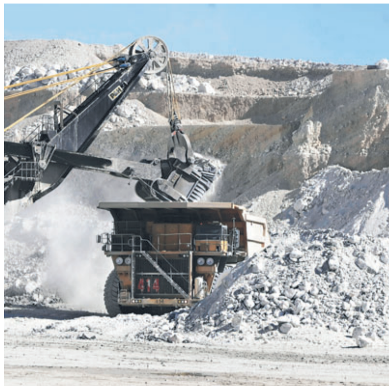
La minería será el sector que acapará las mayores inversiones que inician su construcción el segundo semestre, superando los US$ 12.700 millones.

Según cifras de la Corporación de Bienes de Capital (CBC), las mayores inversiones se registrarán en los sectores minero, energía e inmobiliario. La cifra representa más del 40% del total de la inversión proyectada para el período 2010-2014.