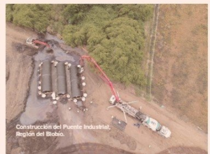
Construcción del Puente Industrial, Región del Biobío.

creativo que se desarrolló en este Proyecto, así como en otros en que hemos participado. Esto nos ha permitido desarrollar propuestas que nuestros clientes valoran, aportando con los mejores productos y servicios para obras de construcción tan desafiantes como el Puente Chacao, Minera Escondida o el radio telescopio Alma, entre otras".